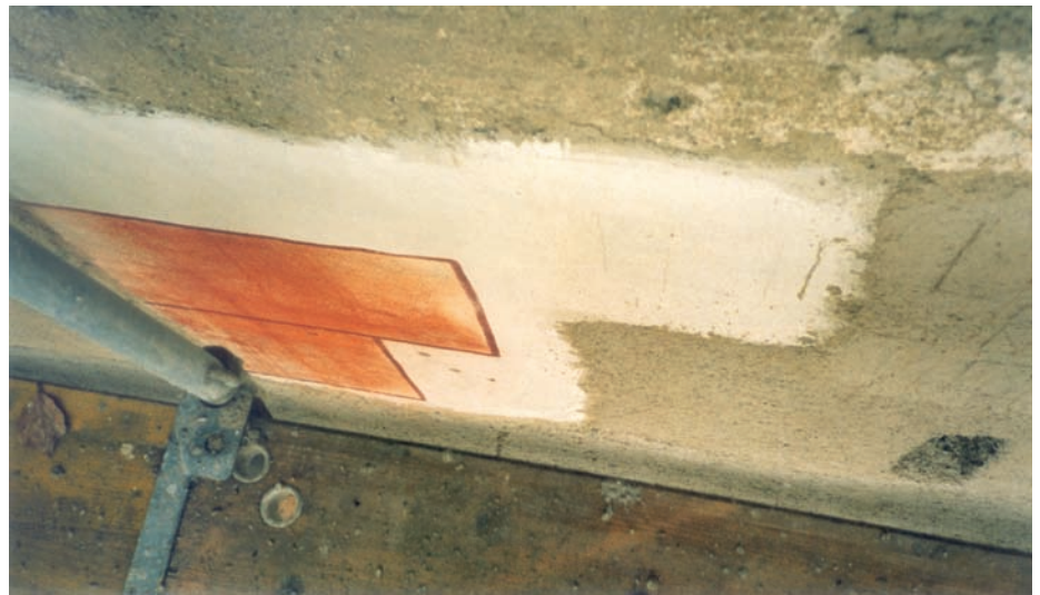
Vor der Ausführung der farbigen Ecklisenen wurde vor Ort ein Muster aufgemalt.

Die Schlacken stammen mit grosser Wahrscheinlichkeit aus den im Raum Frick bekannten Schmelzöfen, welche Eisenerz von den Hochflächen des Tafeljuras verarbeiteten. Die Bauzeit des Storchennestturms und die belegten Erzgruben sind im 13. Jahrhundert anzusiedeln und stehen in Verbindung zueinander. Offensichtlich waren hydraulische Bindemittelkomponenten im