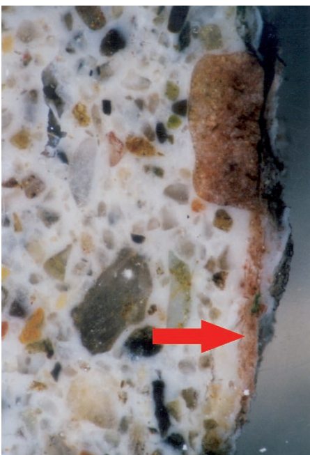
Im Schlifffbild mit 16-facher Vergrösserung sind die Farbreste gut zu erkennen (Pfeil).

Wenn in Bezug auf murale Restaurierungen von Kalk gesprochen wird, ist oft Sumpfkalk (Kalziumhydroxid) gemeint, allenfalls werden Heisskalk und trocken gelöschter Kalk genannt. Doch bei Analysen und Untersuchungen sind – insbesondere an wetterexponierten und gut erhaltenen Fassaden – sehr oft auch hydraulische Bindemittelanteile zu finden. Bekannt und weitgehend untersucht sind Ziegelmehle, Ziegelbruch,