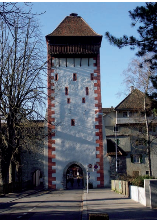
Der Storchennestturm in Rheinfelden wurde 2002 restauriert. Aus einem grauen, düsteren Gemäuer ist dabei ein frisches, zweifarbiges Bauwerk geworden.

Nach Vorliegen der Untersuchungsergebnisse stellte sich für die Denkmalpflege die Aufgabe, diese Resultate zu interpretieren und daraus ein Restaurierungsziel zu formulieren. Wie die archäologischen Untersuchungen ergaben, er-