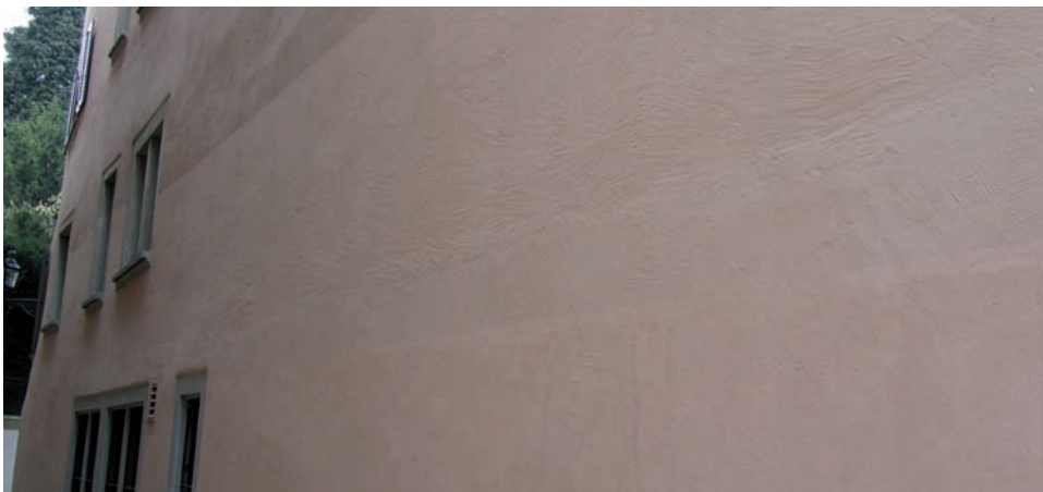
Graffiti-schutzanstriche können beliebig abgetönt werden. In diesem Beispiel wurde der Farbton nicht ideal getroffen.